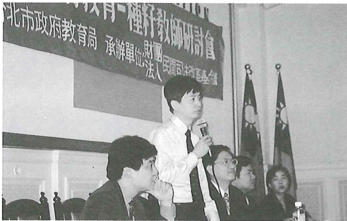
■邀請到蔡法官、陳法官在會場侃侃而談

法不能停留在講的階段，一定要推動、紮根、落實，種子一定要散撥出去。老百姓之所以對司法沒信心，原因有很多，我想也許是司法文化的一部份，老百姓不能說完全沒有責任，但是主要是司法體制要做重大的調整。在這段期間內，看到民間司改會這些人無私的付出，個人覺得很感動，所以有機會便義不容辭參與司法改革。司法改革絕對是