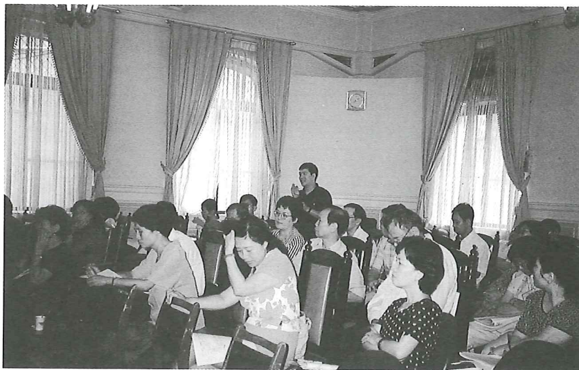
■ 參與的老師們場場爆滿