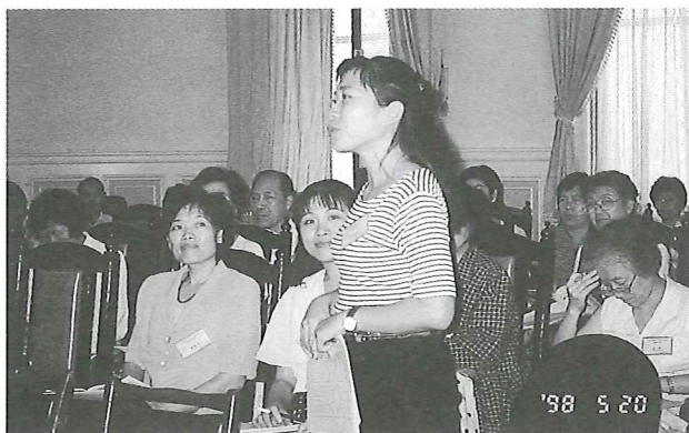
參加講座的老師們發言踴躍

身為法律知能研習的主辦人，滿心欣慰與感激。老師們熱衷參與，共襄盛舉，更期盼法律教育，人人擔負起一分責任，紮實民主法治的根基，革除社會動亂的禍源。