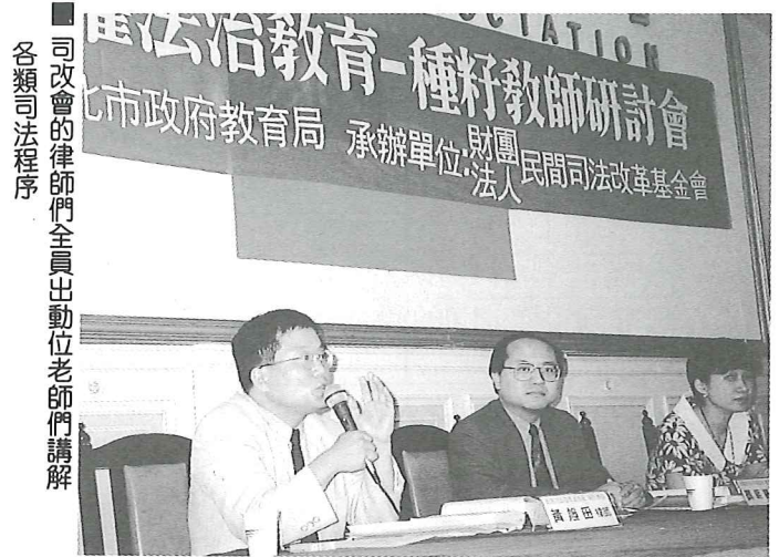
■ 司改會的律師們全員出動位老師們講解各類司法程序