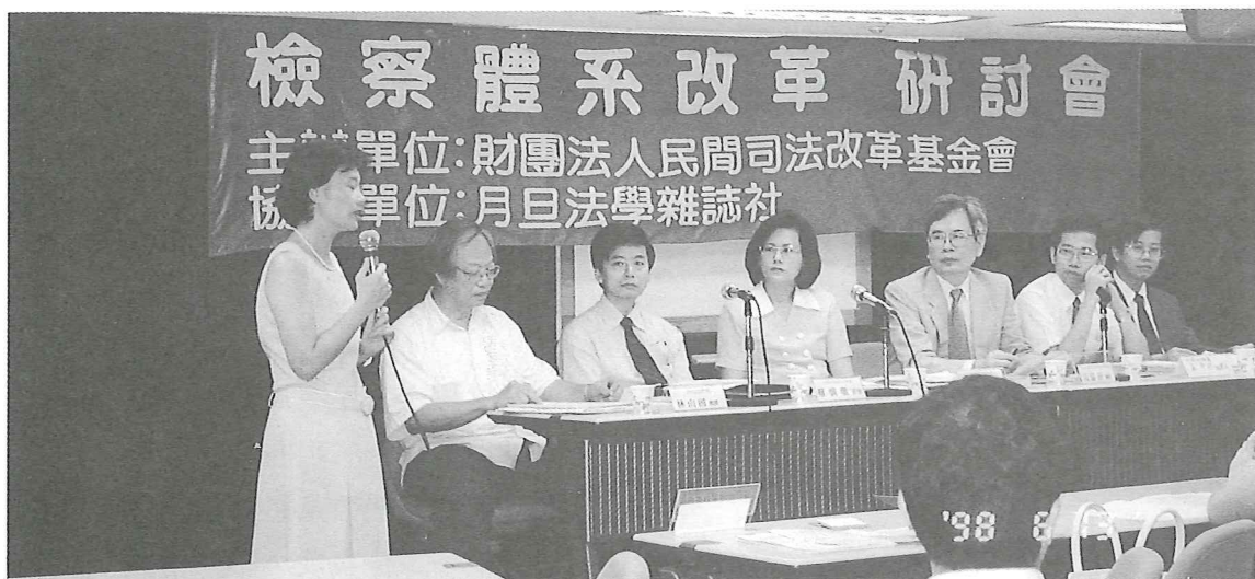
■ 會場與會人士發言踴躍