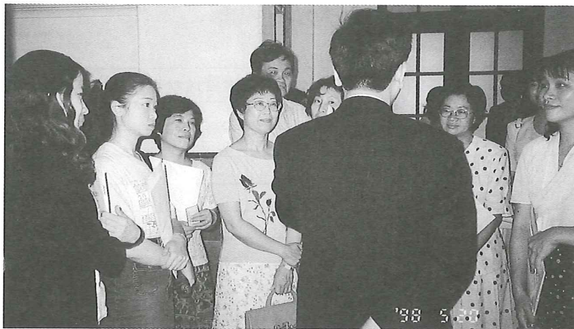
■ 老師們認真聆聽律師說明進入法庭需要注意的事項