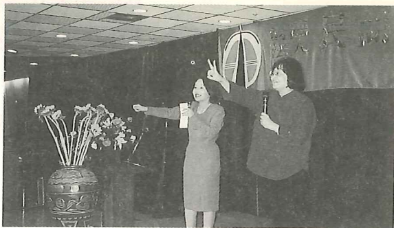
募款餐會上熱絡的喊價